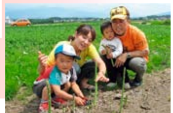
アスパラガス収穫体験