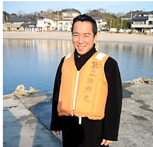
ライフジャケットの着用