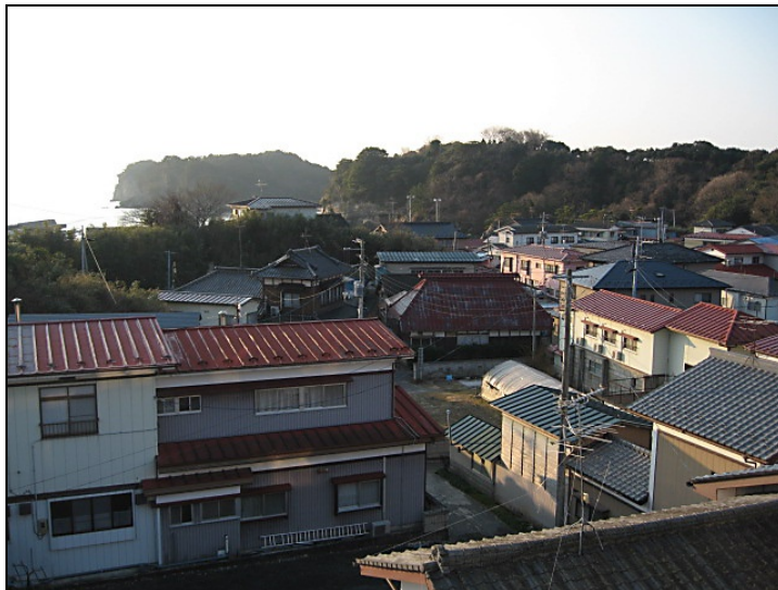
東松島市の漁家の風景（当宿から撮影）

2006 年度は、5 月 1 6 日～ 1 1 月 1 2 日の間に 2 7 件の団体を受け入れました。