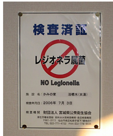
レ レジオネラ属菌検査済証

また、レジオネラ属菌に関して、(財)宮城県公衆衛生協会の検査を受けています(右図)。