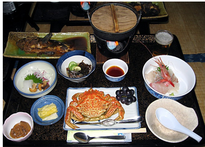
新鮮・衛生に配慮して提供された夕食

そこで、当宿では大きな4台の水槽を設け、海から上がってそう日が立たない魚介類をキープし、新鮮な食材を提供する工夫をしています。